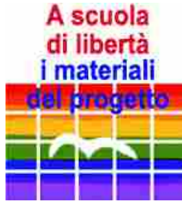
A scuola di libertà