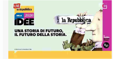
RepIdee26 - Arena del Sole, sala Salmon: la diretta

BOLOGNA - "Io all'inizio della mia carcerazione, che è durata 12 anni e mezzo, pensavo che la mia vita fosse finita. Oggi mi sto rialzando, e ringrazio tutti per la vita che mi hanno ridato oggi".