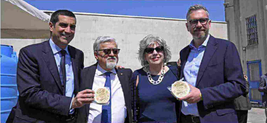
Un altro momento dell'inaugurazione. Da sinistra Michele De Pascale, presidente della Regione Emilia Romagna, Gianpiero Calzolari, Simona Caselli, Matteo Lepore, sindaco di Bologna

Bologna e provincia. Ma la riuscita vera si misurerà attraverso la scelta quotidiana di socie, soci e consumatori. Saranno loro, con un gesto semplice come l'acquisto, a trasformare un prodotto di qualità in un'opportunità reale di lavoro, formazione