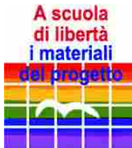
A scuola di libertà

Impegnato da sempre nel mondo del carcere, l'attore Alessandro Bergonzoni sferza istituzioni e politica a fare di più per favorire il reinserimento degli ex detenuti in società. "Lo Stato dov'è? Se devi investire su salute o istruzione la gente vota istruzione e sanità, perché noi ci ammaliamo tutti, mentre in galera non ci andiamo, anche se con l'ultimo decreto sicurezza forse ci andiamo anche noi. Ma in genere non ci andiamo. Il detenuto non fa tenerezza - continua - non c'è un partito politico che si occupi di questi temi, io dopo Pannella ne ho visti molto pochi".