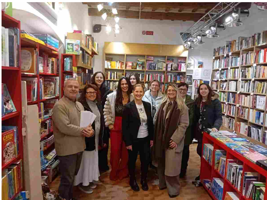
Camst da Aleph a Castelfidardo