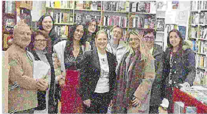
La società che gestisce la refezione scolastica ha donato buoni libri

CASTELFIDARDO La corsa per salvare la libreria indipendente Aleph entra nella fase decisiva. Il termine per sostenere il crowdfunding è fissato al 31 dicembre e la mobilitazione cittadina continua a dare segnali concreti. Fino a ieri la raccolta fondi lanciata a ottobre dai titolari, dopo aver reso pubbliche le difficoltà legate alla crisi del settore librario e del commercio locale, ha raggiunto quota 16.787 euro, con 278 sostenitori. Un risultato che conferma quanto Aleph rappresenta, da oltre 25 anni, un presidio culturale riconosciuto