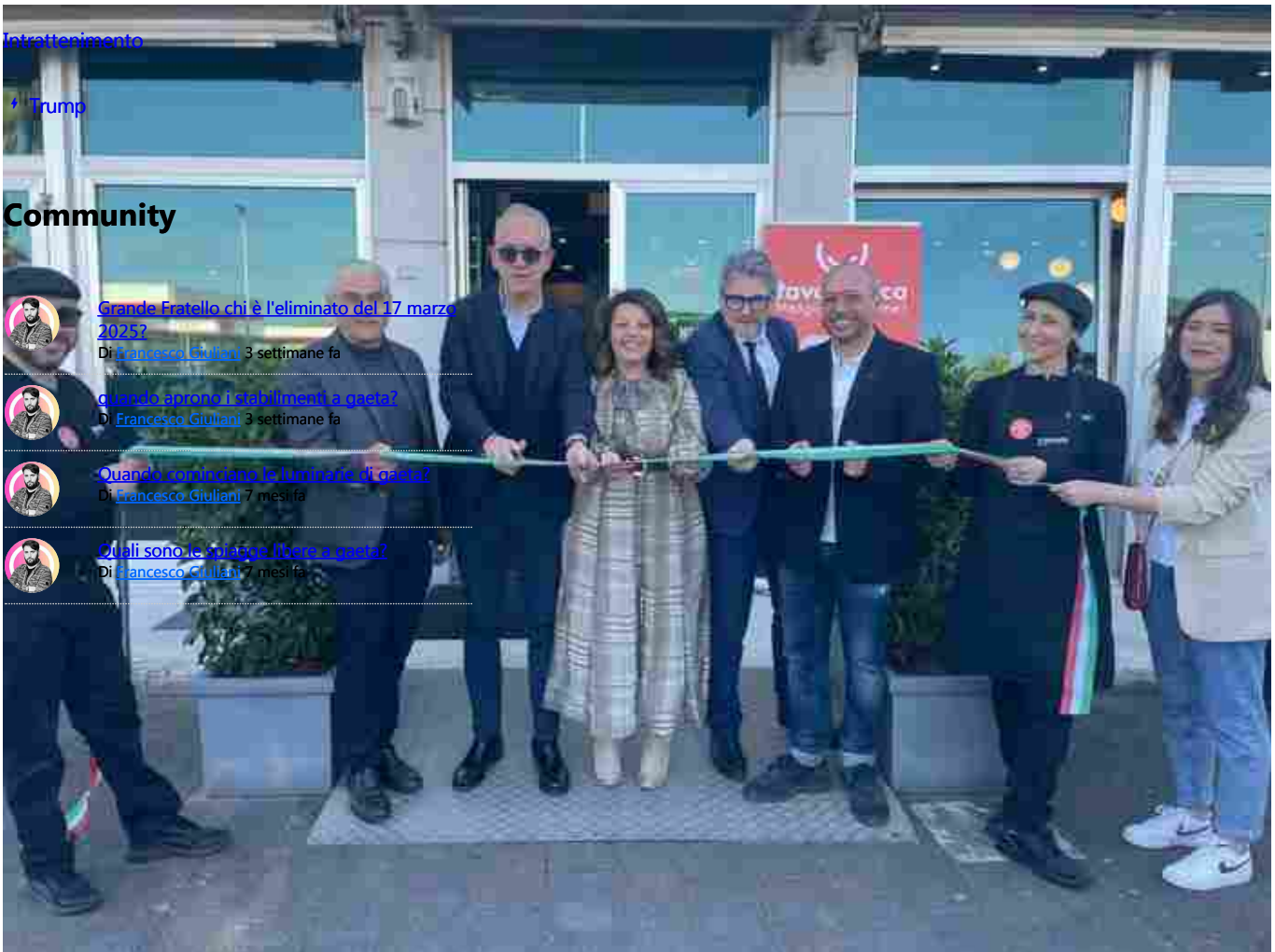
Apertura del ristorante Tavolamica a Civitanova Marche: un nuovo servizio per le imprese locali - Gaeta.it