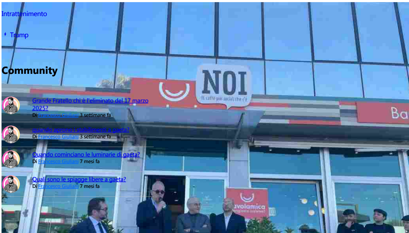
Tavolamica NOI apre a Civitanova Marche: un servizio completo per la zona industriale - Gaeta.it