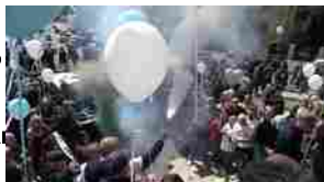
Suor Paola, anche l'aquila Olimpia per l'ultimo saluto alla super-tifosa