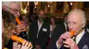
Re Carlo suona un flauto ricavato da una carota