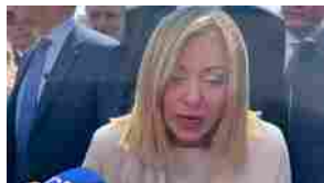
Meloni: "Ragionare su sospensione del Green Deal per l'automotive"